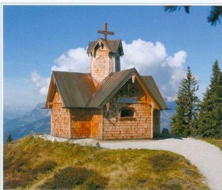
St. Vinzenz-Friedenskirche am Hochgründeck, 1811 m