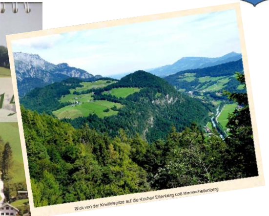
Blick von der Kneifelspitze auf die Kirchen Ebenberg und Marktschellenberg