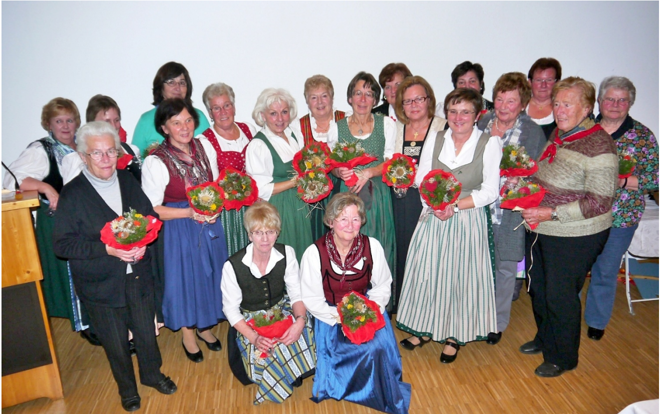
Das Foto zeigt die Gründungsmitglieder und die Geehrten

Am Schluss des schönen Festes blieb nur noch Danke zu sagen an alle die zum Gelingen der Feier beigetragen haben. Der Geburtstagswunsch des Frauenbundes wäre, dass neue Mitglieder, besonders jüngere Frauen, den Weg zum Frauenbund finden, damit die Gemeinschaft lebendig bleiben kann.