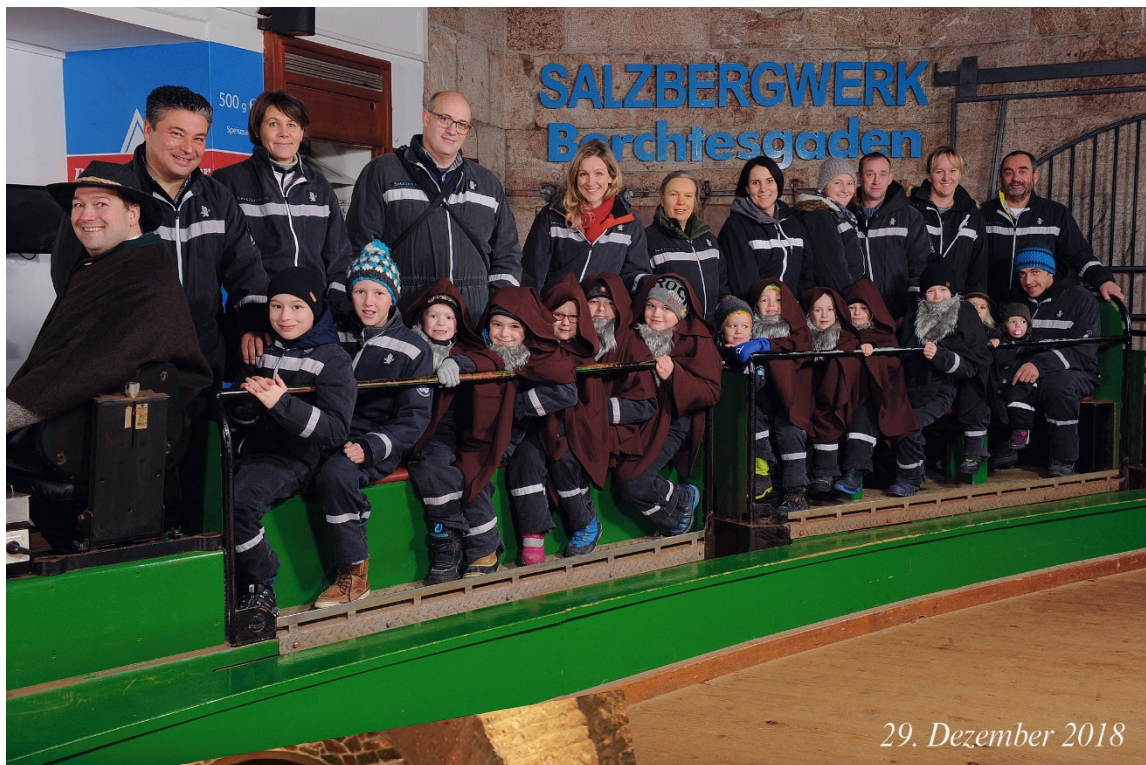
29. Dezember 2018