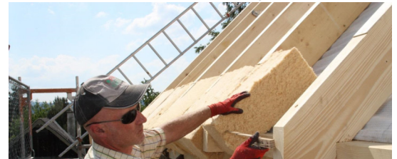
Dachdämmung von außen

Info und Anmeldung unter Telefon 0861 58-70 39. Das Team der Energieagentur freut sich auf die Beratung - weitere Informationen gibt es auch unter www.energieagentur-suedost.bayern .