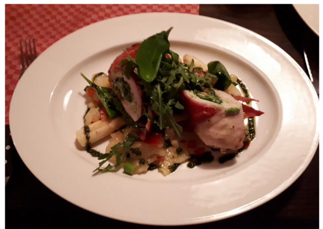
gefüllte Hähnchenbrust auf Bärlauch-Spargel-Kartoffelsalat