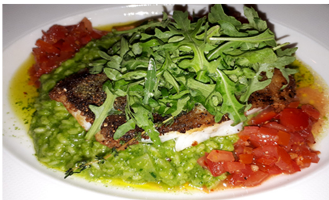
Kabeljaufilet auf Bärlauch Risotto

Herzlichen Dank an das ganze Team vom Gasthaus Oberstein, wir wurden super Verköstigt, die Bärlauchgerichte waren ein Traum!