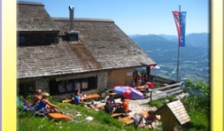
Toni Lenz Hütte

am Untersberg geöffnet Mai bis Oktober Tel.: 0043 660 658 1430 www.toni-lenz-huette.de