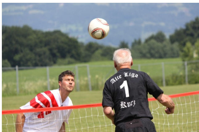
Kurz beim Kampf um die Punkte am Netz