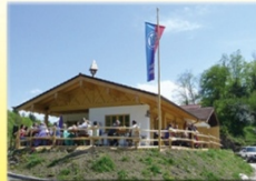
Cafe s' Bamstoa

Barmsteinweg 7 Tel.: 08650/ 1307 www.bamstoa.de