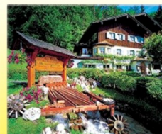
Gasthof zur Kugelmühle

Kugelmühlweg 18 Tel.: 08650/ 461 www.gasthaus-kugelmuehle.de