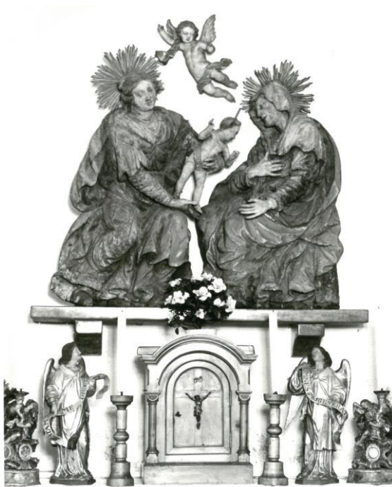
Der Altar der Pfarrhofkapelle in den 80er-Jahren.

Zuvor sind jedoch einige Sanierungsmaßnahmen erforderlich, die im Laufe des Sommers durchgeführt werden: