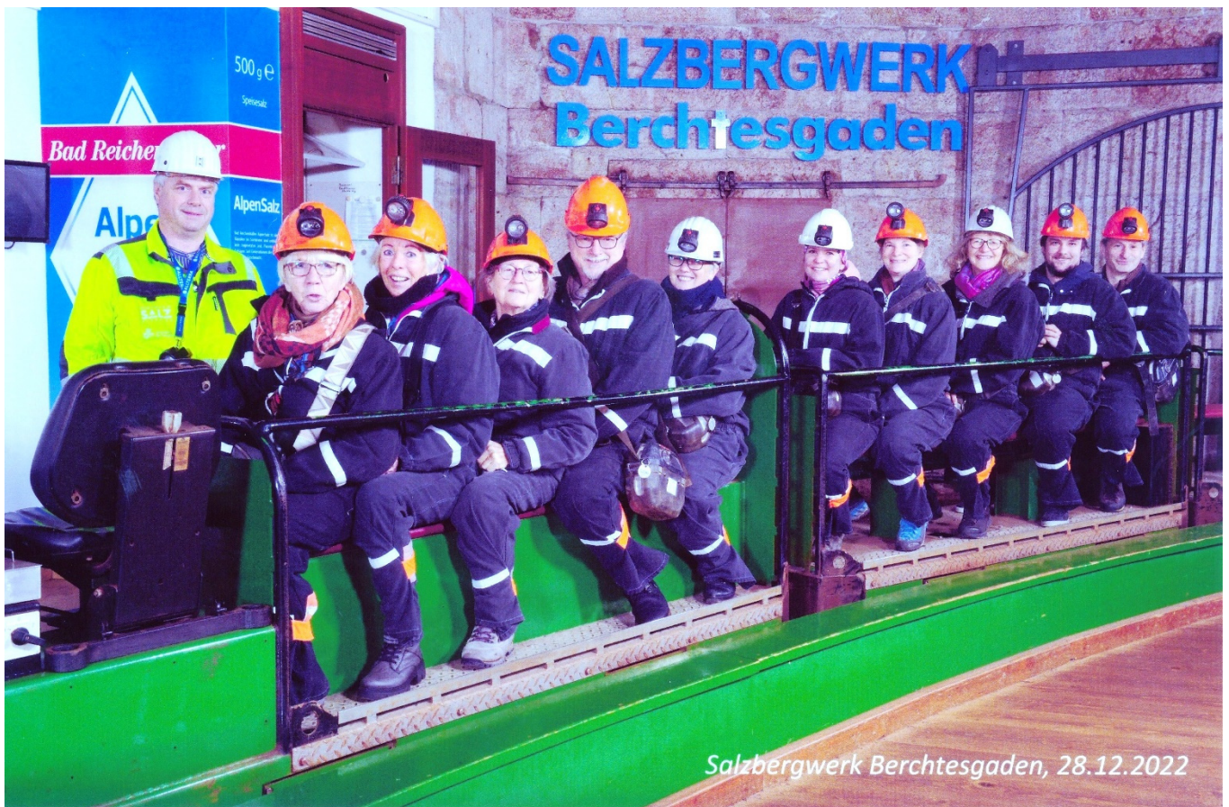
Salzbergwerk Berchtesgaden, 28.12.2022