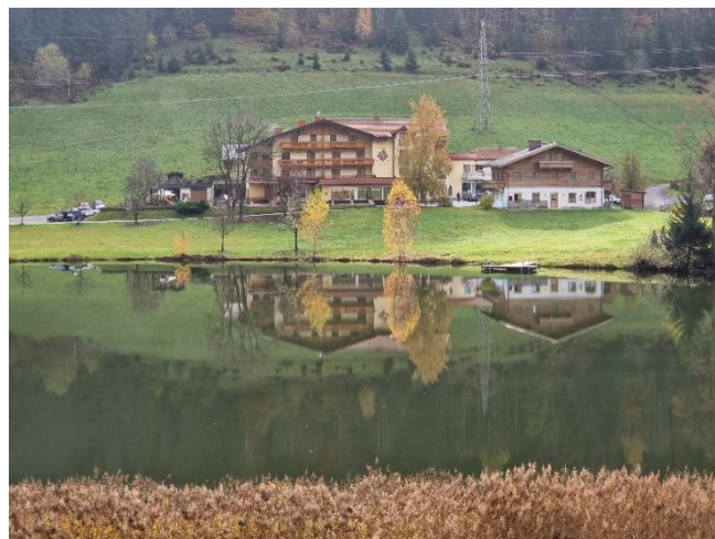
Böndlsee mit Hotel Seeblick